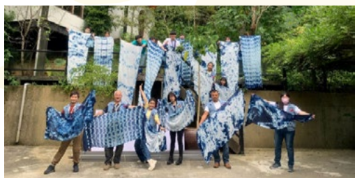
展示藍染作品成果