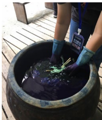
將作品置於藍染染缸中浸泡染色

同時，「卓也藍染」充分運用自然資源，在丘陵上栽種藍草、製作藍靛染料、培育藍染染缸及藍染工藝。「取之自然，用之自然」，保持生活秩序平衡和生態，這種致力於維持人類與大自然共生共存的方式，也十分值得學生學習及延續。