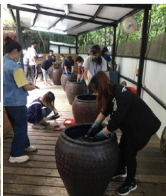
學生都專注在浸泡染色