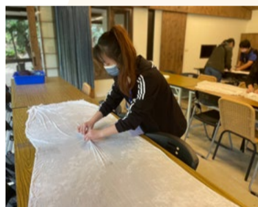
學生學習製作藍染作品

本處於 9 月 24 日舉辦「卓也藍染藝術體驗之旅」，率領一眾外籍生、原住民與新住民學生，前往臺灣苗栗三義鄉「卓也藍染」，學習臺灣獨特的藍染技術，讓學生發揮創意，親手製作獨一無二的藍染作品。同時，活動參訪「卓也藍染」客家村落的环境氛圍，品嚐獨特風味的客家料理，認識臺灣獨有的藝術文化與在地客家風土人情。