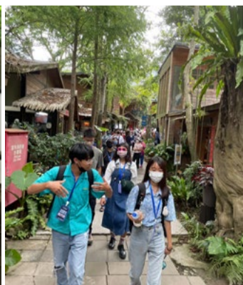
參觀「卓也藍染」客家村落