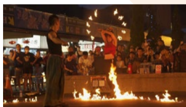
暑期線上讀書會——紀錄片賞析：火中跳舞的蝴蝶

「不管你是被什麼樣的社會標準綁著，為了自己最喜歡的樣子、自己最舒服的形式，朝你的未來。」