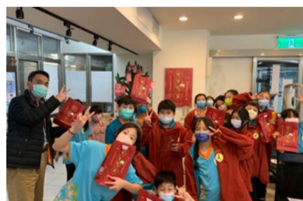
閱讀課程與 OPENBOOK 福袋新書推廣活動結合

開學之際，圖書館新進 2021 年 OPENBOOK 好書獎入圍與得獎新書，包含年度生活書、中文創作書、翻譯書、童書與青少年圖書等五大類別，搭配新春福袋活動，讓讀者在充滿好奇與驚喜的過程中，如尋寶般找尋心目中的好書。藉由發送給本校一、二級主管與助理人員閱讀福袋，鼓勵教職員閱讀，讓大家能在工作繁忙之餘進入書中的世界放鬆身心，讓我們一同閱讀好書，灌溉智慧福田！