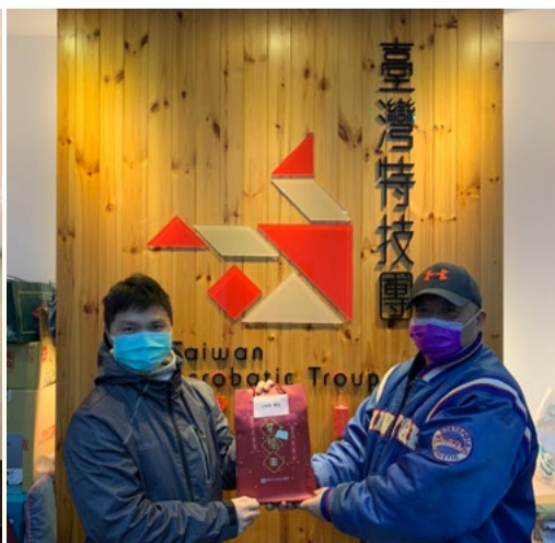
臺灣特技團團長受贈好書福袋