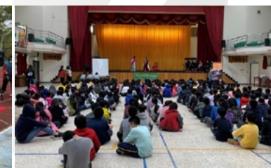
20220322 新竹信勢國小「藝術新4力」插旗巡演《杏花尋醫》