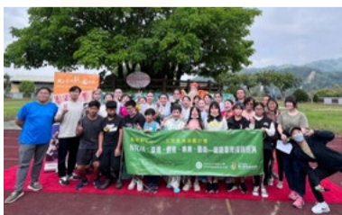
20220317 苗栗新開國小「藝術新4力」插旗巡演