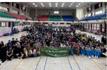
20220322 新竹信勢國小「藝術新4力」插旗巡演大合照