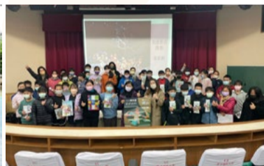
20220221 苗栗建中國小體驗課程大合照