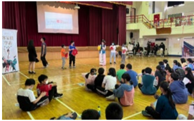
20220331 新竹竹東國小「八角巾」互動體驗