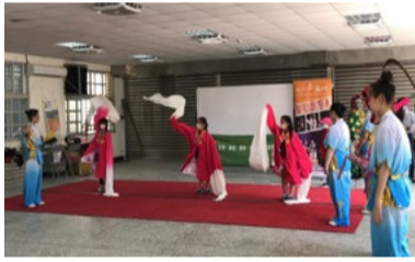
20220329 五城國小「水袖」體驗