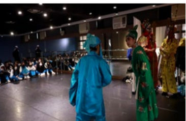
20220222 南強工商小型展演《緣定三生》