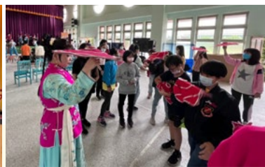
20220331 僑育國小「藝術新4力」插旗巡演「八角巾」互動體驗