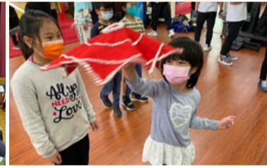
20220331 新竹竹東國小「緣定三生」戲曲欣賞