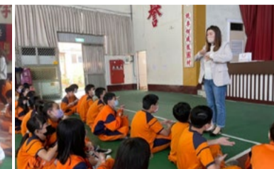
20220314 美感戲遊記 苗栗公館國小「旦角基礎指法教學 - 我」