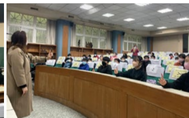
20220221 苗栗建中國小旦角基礎指法「蘭花指」延伸學習「你」