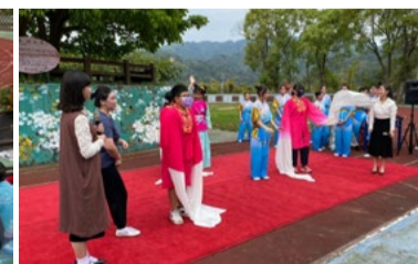
20220317 苗栗新開國小「藝術新4力」插旗巡演「水袖」互動體驗