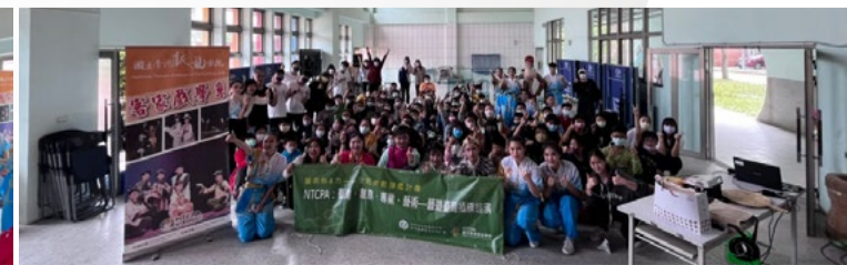
20220331 僑育國小「藝術新4力」插旗巡演大合照