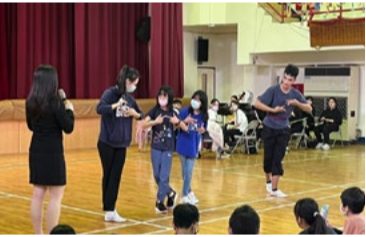
20220331 新竹竹東國小「旦行指法 - 我」互動體驗