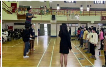
20220331 新竹竹東國小「三功表演」