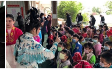
20220401 明德國小「八角巾」互動體驗