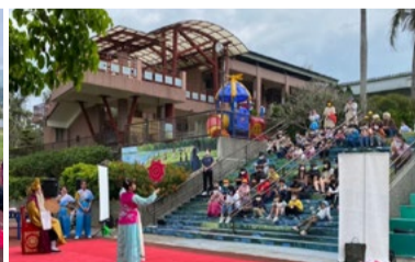
20220317 苗栗新開國小「藝術新4力」插旗巡演《杏花尋醫》