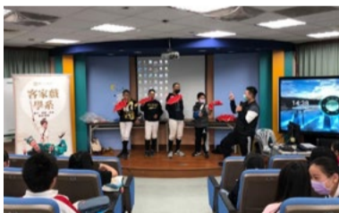
20220307 美感戲遊記 新北汐止國小「八角巾」互動體驗