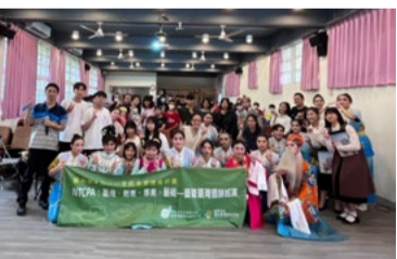
20220314 桃園東明國小「藝術新4力」插旗巡演