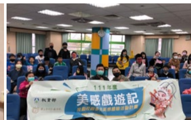
20220307 美感戲遊記 新北汐止國小大合照