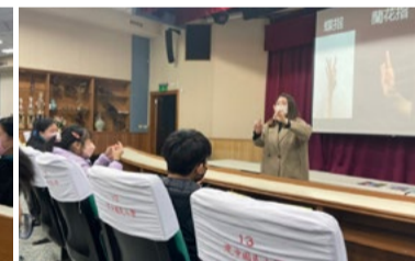
20220221 苗栗建中國小體驗課程旦角基礎指法「蘭花指」教學