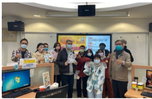
0112 戲曲大大讀書會成果發表會

木柵戲曲大大讀書會特色在於透過雙師帶領、用書選自 HamiBook 管理類及文學類電子書，以一週導讀及一週討論的方式，同時運用高教深耕計畫社團幹部人力進行管理，搭配讀書會深度閱讀及與里辦公室合作推廣，提升學生閱讀及發表能力，每月皆有破千的借閱量，除為善盡大學社會責任(USR)盡一份心力外，也達到圖書館數位閱讀推廣的新里程碑！