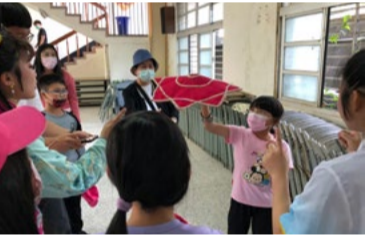
20220329 五城國小「八角巾」體驗

《杏花尋醫》則有著猜謎語，客家師父話、諧音、誇飾等的文字趣味，是一齣節奏輕快，情緒變化多樣的折子戲。本次巡演皆由客家戲學系的老師和高中部學生及傳統音樂學系學生共同努力才能圓滿完成，期許借由巡演活動的推廣下，能有更多新血加入！