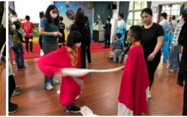
20220331 栗林國小「水袖」互動體驗