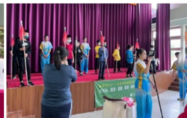
20220331 僑育國小「藝術新4力」插旗巡演「八角巾」互動體驗