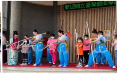
20220330 南投成德國小「雙頭槓」體驗