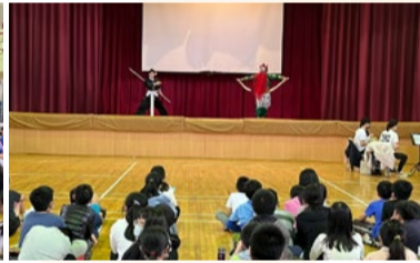
20220331 新竹竹東國小「白水灘」戲曲欣賞