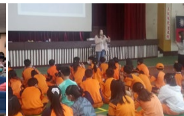
20220314 美感戲遊記 苗栗公館國小「旦角基礎指法教學 - 你」