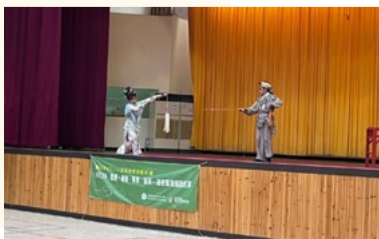
20220322 新竹信勢國小「藝術新4力」插旗巡演《盜仙草》