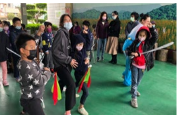
20220401 明德國小「刀匹子」互動體驗