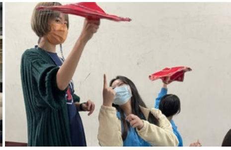
學生練習轉八角巾