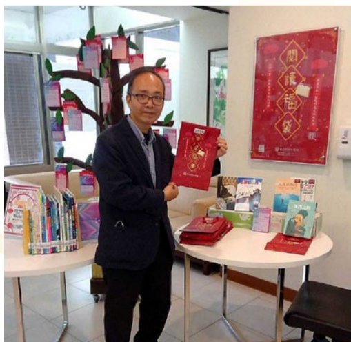
國立臺灣戲曲學院校長推廣 openbook 好書