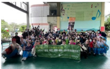
20220401 明德國小「藝術新4力」插旗巡演大合照