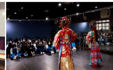
20220222 南強工商小型展演《打金枝》