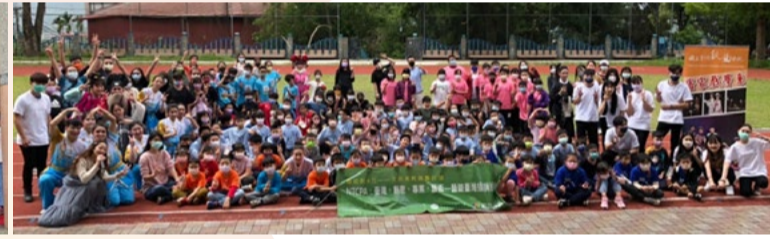
20220330 南投成德國小「藝術新4力」插旗巡演大合照