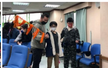
20220307 美感戲遊記「馬鞭」及人體彩繪「創意猴臉」互動體驗