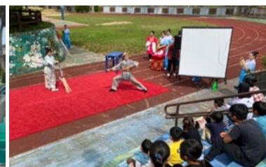
20220317 苗栗新開國小「藝術新4力」插旗巡演《盜仙草》